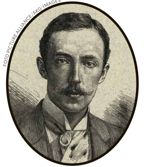
FRIEDRICH KARL VON HESSEN