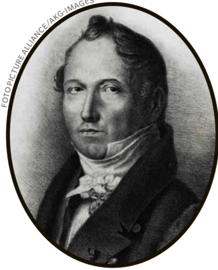
CARL LUDWIG ENGEL

Wer nach Helsinki reist, kommt am Stockmann, dem KaDeWe der Stadt, nicht vorbei. Es ist nicht nur das feinste und größte Kaufhaus der Hauptstadt, sondern ganz Nordeuropas: 182 Geschäfte mit gut 50.000 Quadratmetern Verkaufsfläche allein im Haupthaus. Die Wurzeln des Erfolgs liegen jedoch in Lübeck: 1852 kam ein finnischer Kaufmann nach Deutschland, um einen Buchhalter für seine Glasfabrik zu suchen. Er entschied sich für Georg Franz Heinrich Stockmann (1825–1906), der dann bei Minustemperaturen und in der von Eisschollen durchzogenen Ostsee in einem Postboot nach Finnland segelte. Zehn Jahre lang war er Mitarbeiter der Fabrik, dann gründete er seinen eigenen Haushaltswarenladen, das Stockmann. Heute ist Stockmann eine AG, hat 9500 Mitarbeiter und Filialen in Finnland, Russland, Estland und Lettland. Stockmanns Urenkel Karl, der immer noch Familie in Lübeck hat, betreibt als Geschäftsführer des Warenhauses einen Versandhandel, die Modekette Seppälä und Autohäuser, die auch deutsche Marken wie VW oder Audi verkaufen. Außerdem hat Stockmann mit dem spanischen Modehaus Zara einen Franchise-Vertrag für Finnland und Russland geschlossen. Denn in Finnland laufen die Geschäfte wegen der Russland-Sanktionen gerade nicht so gut.